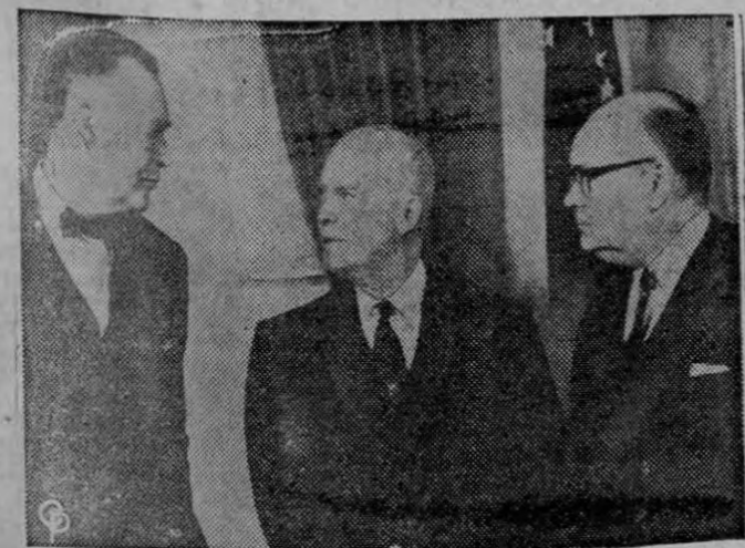
DISCUTIENDO SU VIAJE.—El Presidente Eisenhower aparece mientras conferencia en la Casa Blanca con el Secretario de Estado, Christian A. Herter, (izquierda) y Paul Henri Spaak, Secretario General de la OTAN. Los tres discutieron acerca de la reunión de Ministros Exteriores de la OTAN, a celebrarse en París en el mes de diciembre. Más tarde Spaak le dijo a los periodistas que él y el Jefe Ejecutivo discutieron acerca del recorrido de Eisenhower por 11 días.